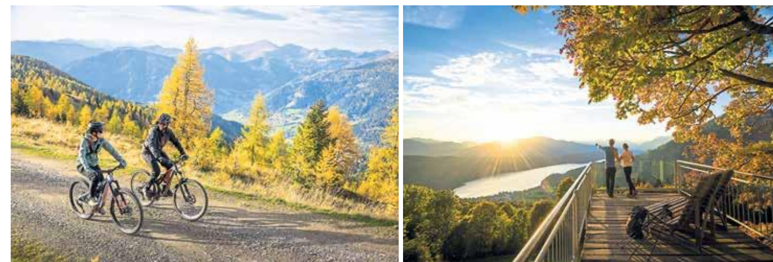
Mit dem Mountainbike zum Gipfel (l.), Herbstliche Aussichten vom Sternbalkon über dem Millstätter See.