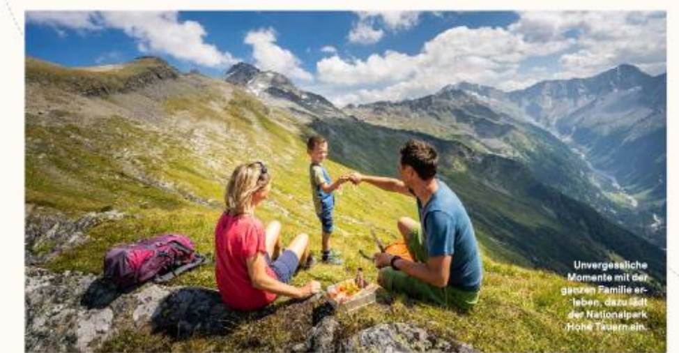
Unvergessliche Momente mit der ganzen Familie erleben, dazu ist der Nationalpark Hohe Tauern da.

Wo Berggeier ein Auge auf dich haben und der Wald betet , ist man nahe einem Märchenland, oder in diesem Fall, im Seebachtal in der Nationalpark-Region Hohe Tauern angekommen. Das Hochgebirgstal zieht große und kleine Abenteuerer, entlang des fast ebenen Naturlehrwegs mit Naturphänomenen wie dem „betenden Wald“, dem „Eisloch“ und den Schlierwasserfällen, in seinen Bann. Bei all den Entdeckungen am Wegesrand lädt eine Einkehr in der Jausenstation Schwusnerhütte zur Stärkung ein. Perfekt abgerundet wird der Erlebnisstag dabei mit einem reichhaltigen „Frigga“- auch bekannt als Speck-Käse-Omelette.