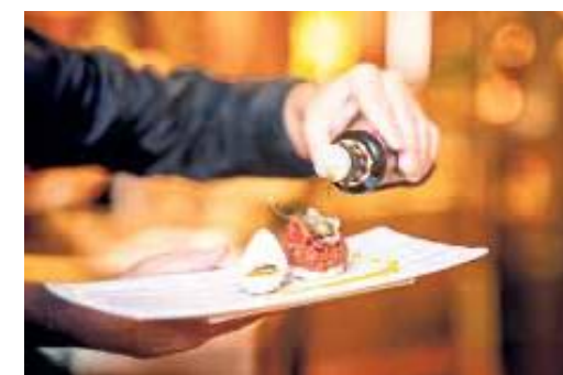
GenussZEIT bei den Kulinarischen Nächten.

Die „coolsten“ Plätze, entspanntesten Wim-Hof-Retreats und besten Tipps zum Kaltbaden! Während im Sommer die sportliche Aktivität und der Spaß im Vordergrund stehen, rückt bei Bädern unter 15 Grad die Heilkraft des kalten Wassers in den Mittelpunkt. Richtig eingesetzt stärkt Kälte das Immunsystem, reduziert das Stressempfinden, hemmt Entzündungen und sorgt für einen erholsamen Schlaf. Es steigert das Wohlbefinden und hat eine beeindruckende Wirkung auf die Psyche. An den großen Kärntner Seen wird das ganze Jahr über gebadet.