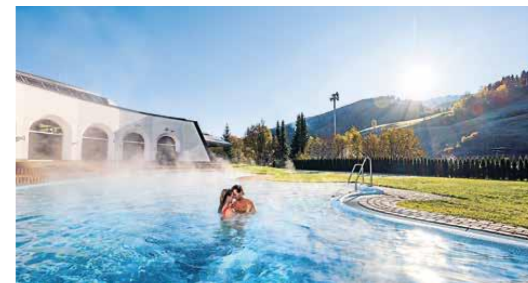
Im Außenpool des Thermal Römerbads in Bad Kleinkirchheim lässt es sich herrlich entspannen.

E in Urlaub zwischen See und Berg verspricht eine Entdeckungsreise zwischen Gipfelsiegen, Kaltbadeplätzen und warmen Thermalquellen. Wenn sich die Berghänge in leuchtende Herbstfarben kleiden, ist klar: Die goldene Jahreszeit hat den Süden Österreichs erreicht. Die Höhen der Nockberge erklimmen, in den klaren Seen baden und in warmen Thermalquellen entspannen – Kärnten bietet für jeden Geschmack das passende Herbstabenteuer.