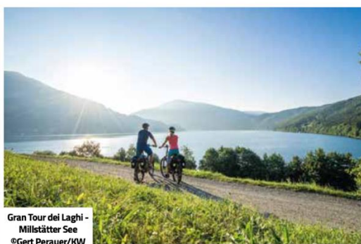
Gran Tour dei Laghi - Millstätter See

PER PEDALARE, STRADE INFINITE Uno dei percorsi più belli è il "Gran Tour dei Laghi Carinziani" (da fare in mountain bike, bici da corsa o con un'e-bike), lungo 420 km: la forma a doppio anello consente di calibrare il percorso a proprio piacimento. L'itinerario comprende 20 dei laghi più belli della Carinzia. I cicloturisti possono concentrarsi sulle bellezze del paesaggio senza preoccupazioni: sulle piste ciclabili segnalate con cura si trovano 50 centri