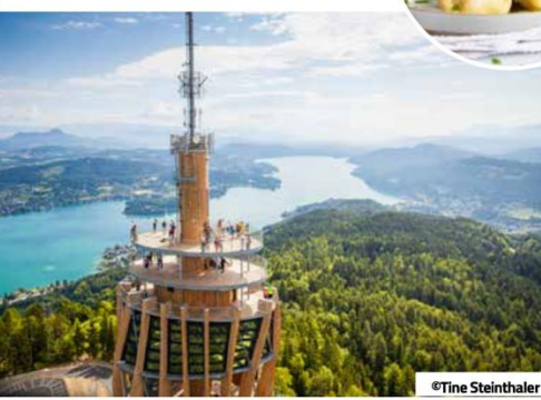
Lago Faaker See

ECCellenze con la GUIDA SLOW FOOD 2023 Per un viaggio gastronomico in Carinzia ci si può ispirare ai programmi d'esperienza delle tre zone Slow Food Travel (valli Lesachtal, Gailtal, Gitschtal - lago Weissensee dal 2015, e valle Lavanttal dal 2020, la Carinzia centrale dal 2022). Questi programmi offrono l'occasione per uno sguardo dietro le quinte dell'economia circolare sostenibile e nelle pentole dei ristoranti. In oltre nella guida Slow Food (in tedesco) si trovano più di 90 ristoranti e oltre 30 osterie e rifugi d'alpeggio che hanno ottenuto l'ambito marchio della chiocciola Slow Food - un prezioso aiuto nella ricerca di alimenti sani e genuini, lavorati e rielaborati ad alta qualità secondo l'interpretazione stagionale, tradizionale o moderna.