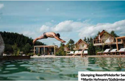
Glamping Resort Pfadorfer See

LAGHI BALNEABILI: FASCINO E DIVERTIMENTO Splendidi per nuotare e praticare attività acquatiche. Sul Wörthersee è possibile fare un giro in stand-up paddle, ma se si preferiscono le discipline olistiche, è un meraviglioso hotspot di yoga. Sul Weissensee, inoltre, c'è una zattera da diporto, che combina esperienze naturali speciali con delizie culinarie locali; la pagaiata nelle "Everglades" al Faaker See o le gite in barca a remi nelle baie al Millstätter See sono esperienze uniche per i più romantici.