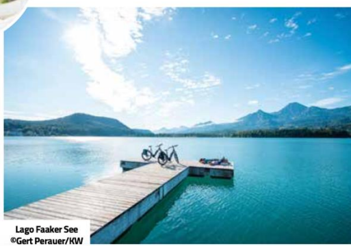
Campaggio sul lago Millstätter See