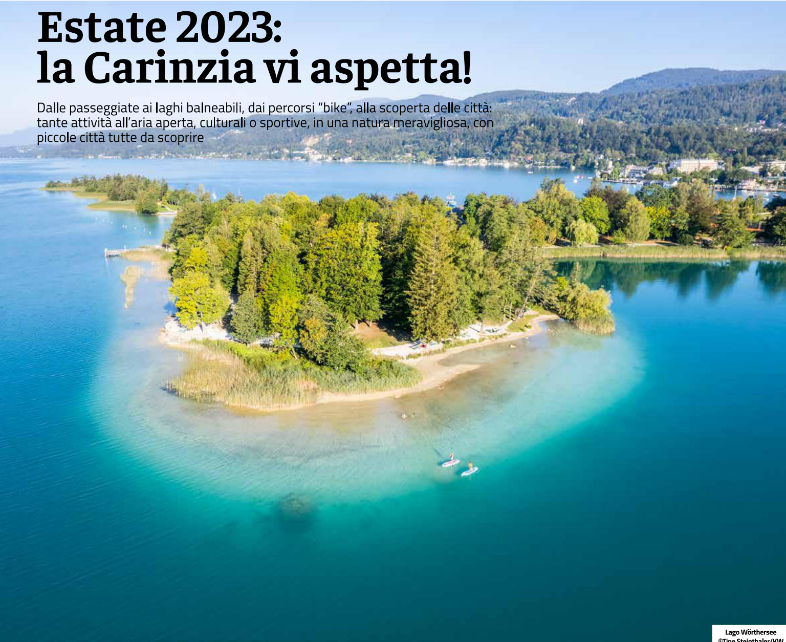
Lago Wörthersee

Dalle passeggiate ai laghi balneabili, dai percorsi "bike", alla scoperta delle città: tante attività all'aria aperta, culturali o sportive, in una natura meravigliosa, con piccole città tutte da scoprire