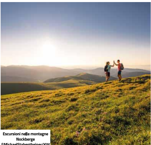
Escursioni nella montagna Nockberge

ATTIVITÀ OUTDOOR: TREKKING E PASSEGGIATE La natura della Carinzia consente camminate sui pascoli alpini, sulle sponde dei caldi laghi balneabili (Wörthersee, Weissensee, Ossiacher See, Faaker See, Millstätter See, Klopeiner See e tanti altri) e sui sentieri di montagna, nelle valli e lungo i principali fiumi come la Drava e il Gail. Gli "Slow Trails" vicini ai laghi sono 20, non sono lunghi più di 10 chilometri e hanno un dislivello di meno di 300 metri. Sono cammini rilassanti, ognuno con sue caratteristiche per ammirare storia, architettura e natura. Tante anche le proposte di escursioni e attività organizzate: trekking sui ghiacciai, osservazione dei cervi rossi, yoga in riva al lago, passeggiate all'alba o anche viaggi alla scoperta delle strade panoramiche della Carinzia, con scorci incantevoli sul paesaggio e scenari mozzafiato. Esiste poi la possibilità di fare un'escursione a lunga distanza, dal ghiacciaio al mare, l'Alpe Adria Trail: ben 43 tappe giornaliere (ma non tutti lo fanno per intero, la maggior parte sceglie solo alcune tappe), dalla Carinzia attraverso la Slovenia, si raggiunge l'Alto Adriatico in Italia.