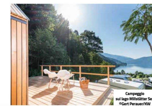
Campaggio sul lago Millstätter See