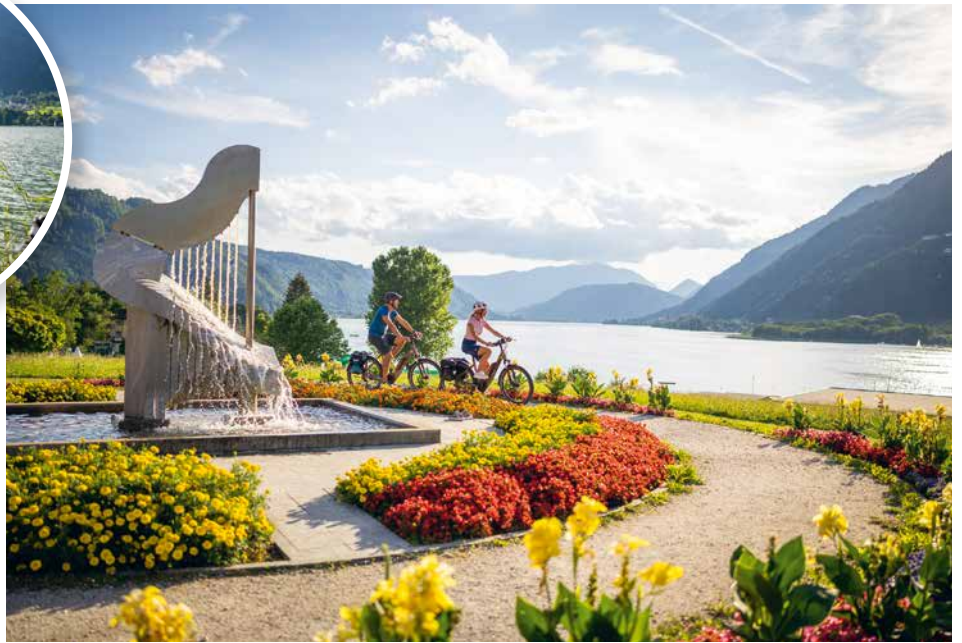
▲ De Ossiacher See