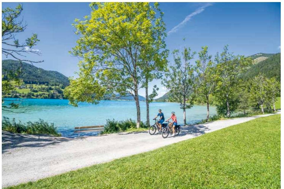
▼ De Weissensee

In Karinthië worden fietsers met open armen ontvangen. De regio heeft zich de laatste jaren met allerlei maatregelen en investeringen tot een zeer aantrekkelijke bestemming voor fietsers ontwikkeld - de ietwat langere reis vanuit Nederland meer dan waard!