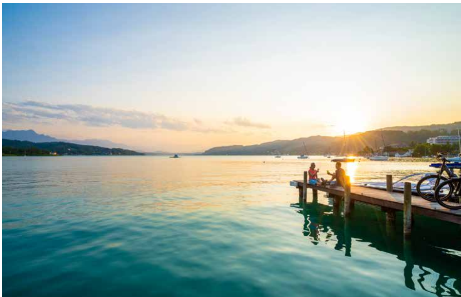
◀ Heerlijk relaxen aan de Ossiacher See

levensgenieters, natuurliefhebbers, romantici en sportievelingen!