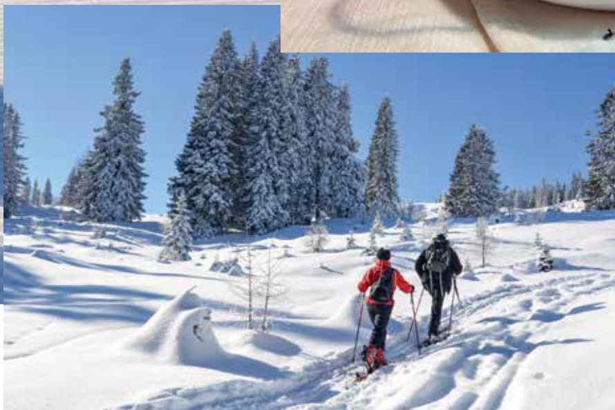
Túra k vrcholu Dobratsch je oblíbenou trasou skialpinistů z Villachu

supercarvingové dálnice lemují expresní 8sedačku Neugarten, nejdelší červený sjezd s 1 000m převýšením pak roluje podél dvou navazujících rychlých 4sedaček Klösterle I a II. Strmější a subtilnější černá a červená sjezdovka se noří do mělkého údolíčka k vleku Pacheiner. Členitě a hravě červené sjezdovky zase obíhají luxusní 6sedačku Wörthersee, u níž se sluní luxusní hotelový resort Feuerberg. Na úpatí sjezdovek v mezistanici Kanzelhöhe, v Klösterle a na Feuerbergu jsou výukové svahy pro nejmenší.