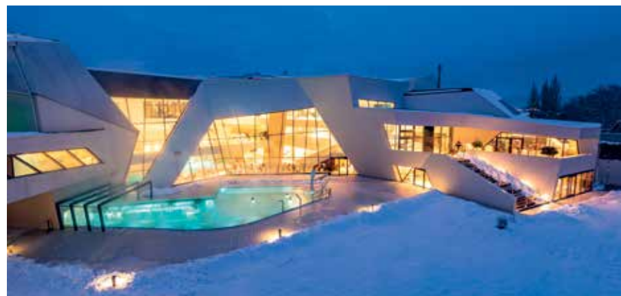
Relax v lázních Kärnten Therme a lyžování na Gerlitzenu lze s permanentkou Ski & Therme kombinovat libovolně

I když Villach nepatří mezi nejlákavější čistě lyžařské destinace, nabídne příjemné zázemí pro méně ambiciózní lyžařské návštěvníky a zvláště pak pro ty, kteří ocení různorodost zimních aktivit, jež tu lze provozovat. Až se chce obyvatelům Villachu trochu závidět jejich domov, z něhož to vše mají „za rohem“.