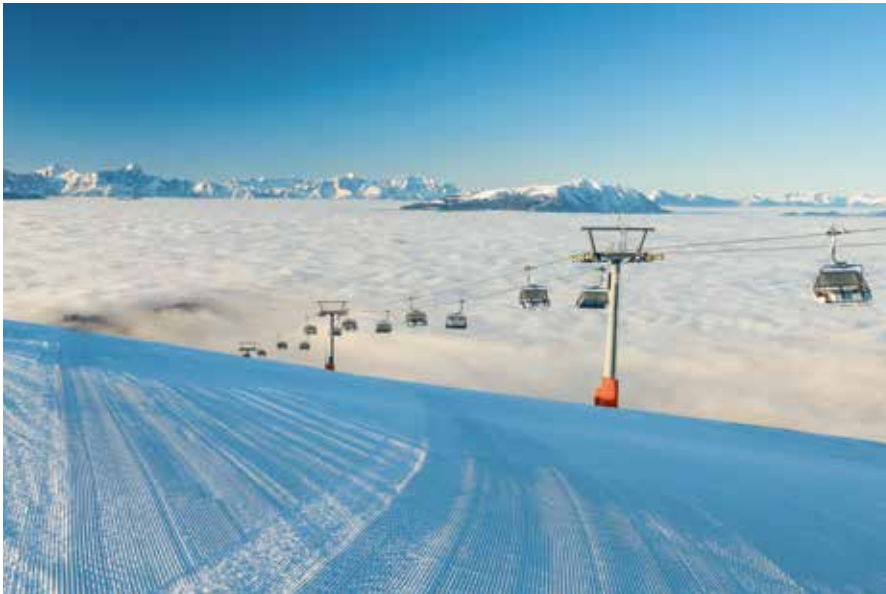
Po vrcholové pláni Gerlitzenu se rozbíhají široké carvingové dálnice a přímo z vrcholu je panoramatický výhled na jezera kolem Villachu a hřeben Karnských Alp a Karavane