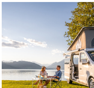
Kamperen in Karinthië