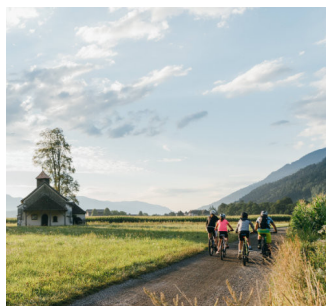
Karinthië - Drau- fietsroute