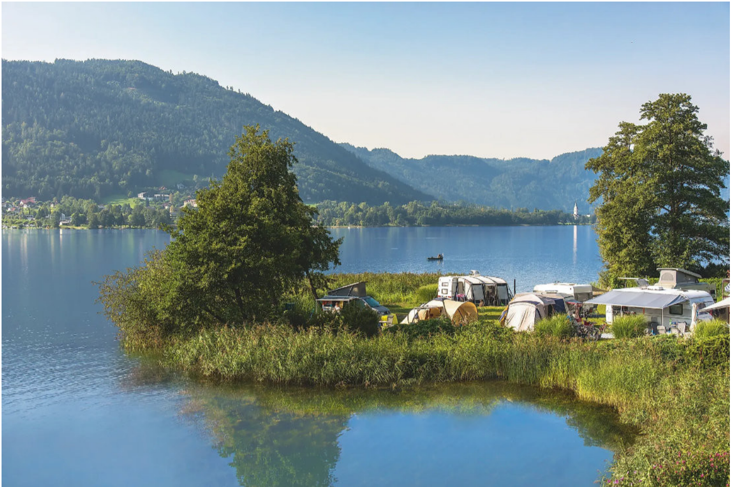
Kamperen in Karinthië, Seecamping Hoffmann