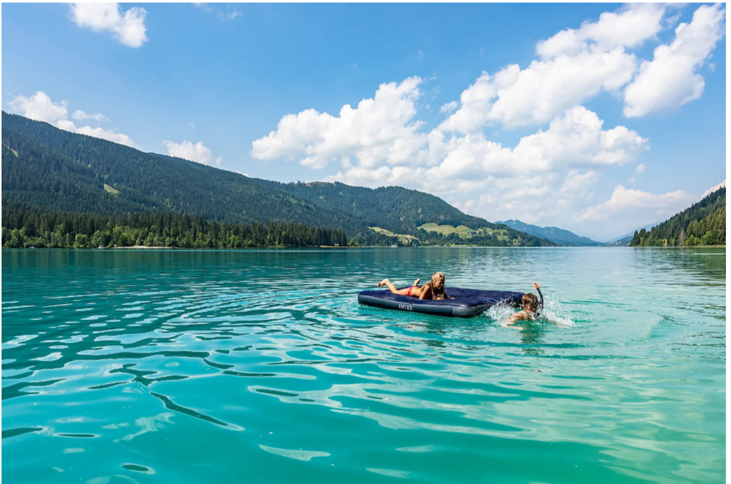
Weissensee in Karinthië

Het pakket ' Flow Trails Kärnten ' is uniek in Oostenrijk. En met de zogenaamde ' Flow Trail Card ' kun je bij de 30 Flow Trails in de vijf mountainbike-regio's (de bikeparken Nassfeld, Weissensee, Turracher Höhe, Bad Kleinkirchheim en Petzen) terecht. Van mei tot oktober.