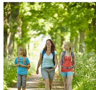
Wandelen in de Graafschap Renthaim