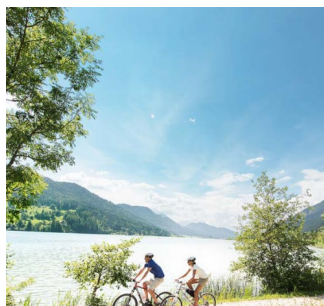
Karinthië - Fietsen