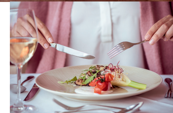
V restauraci Falkensteiner Hotel & Spa Carinzia si na své přijdou milovníci různých světových kuchyní.

překvapí. Díky spojení různých vlivů mezinárodní kuchyně a poloze hotelu na rakousko-italských hranicích je nabídka tak rozmanitá, že nebudete vědět, co ochutnat dříve. Nechybí salátový bar, výběr sýrů, polévka, různé druhy těstovin, a dokonce ani vlastní pizza! Ale to mluvíme jen o předkrmu. Hlavní chod si vybíráte z nabídky tří jídel – maso, ryba nebo vegetariánská varianta. A sladká tečka nakonec? Třeba budete mít štěstí na typický alpský Kaiserschmarrn nebo šišky s mákem.