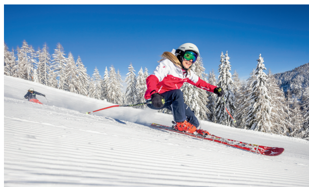
Když si svůj skipas zaregistrujete do aplikace Skiline, můžete si měřit najeté kilometry, sbírat body za splnění lyžařských výzev a soutěžit o skipasy nebo servis lyží.

„V Nassfeldu svítí slunce o sto hodin déle než na severu Alp, mraky se zastaví o Vysoké Taury.“