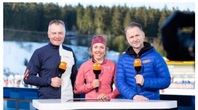
Biathlon aus Ruhpolding an fünf Tagen live im ZDF