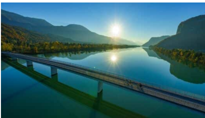
Drauzugradweg gewinnt Bike&Travel Award 2024 - ANHÄNGE

Die große Online-Datenbank für Presseinformationen in Text, Bild, Audio und Video. Pressemitteilungen und Pressematerial zu sehr vielen verschiedenen Themen. Ein Service von news aktuell aus der dpa-Firmengruppe. Internetseite: www.presseportal.de