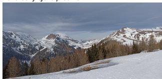
Nockberge z Bunnachalmu