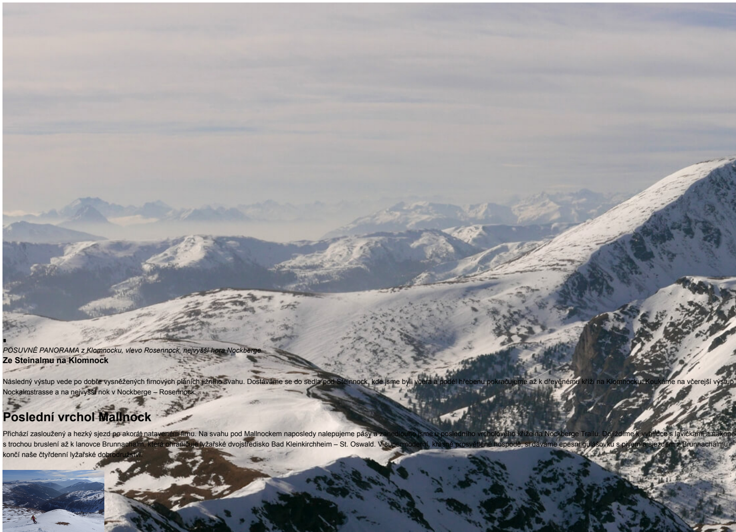
POSUVNÉ PANORAMA z Klomnocku, vlevo Rosennock, nejvyšší hora Nockberge Ze Steinalmu na Klomnock

Následný výstup vede po dobře vysněžených firnových pláních jižního svahu. Dostáváme se do sedla pod Steinock, kde jsme byli včera a podél hřebenu pokračujeme až k dřevěnému kříži na Klomnocku. Koukáme na včerejší výstup na Nockalmstrasse a na nejvyšší nok v Nockberge – Rosennock.