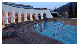
Bad Kleinkirchheim nabízí výborný relax po túře i lyžování v termálech Römerbad a St. Kathrein