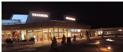
Lázně Römerbad v Bad Kleinkirchheim

Po chvíli vyseďáme z auta před zrekonstruovaným termálním areálem Römerbad, který si za zvýhodněnou cenu mohou sjezdaři přikoupit ke skipasu. Nás lákají hlavně sauny a tak se po termálním relaxu v silných proudech a ve vířivce přesouváme do saunového světa. Stihneme hned dvě organizované seance a nakonec nás pobaví samozvaný italský animátor ve finské sauně, který sršel vtipem a k tomu byl jazykově nadaný. Povedená tečka!