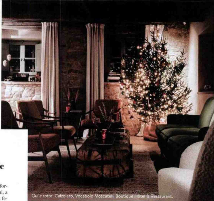
Qui e sotto: Calzolaro, Vocabolo Moscatelli Boutique Hotel & Restaurant.