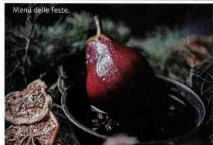
Menù delle feste.

DORMIRE a Calzolaro • Vocabolo Moscatelli Boutique Hotel & Restaurant : relais country chic, doppie dal design moderno, bar "Matite" con ottimi vini locali, ristorante con giardino d'inverno e piatti che reinterpretano la tradizione. Doppia da 320 euro, vocabolomoscatelli.com