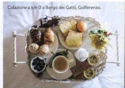
Colazione a km 0 a Borgo dei Gatti, Golferenzo.