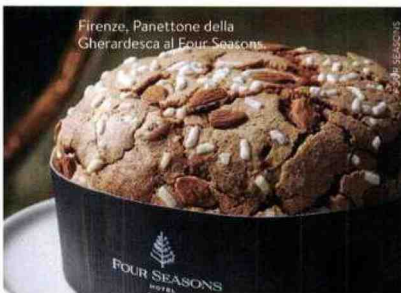
Firenze, Panettone della Gherardesca al Four Seasons