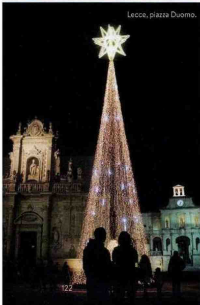
Lecce, piazza Duomo.