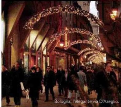
Bologna, l'elegante via D'Azeglio.