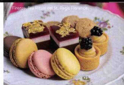
Firenze, Tea Ritual del St. Regis Florence

• AC Hotel Firenze: spaziose camere di design, terrazza panoramica a pochi passi dalla Leopolda, doppia b&b da 384 euro, marriott.com • Foresteria 5 - Wyndham Garden Florence: struttura moderna nel quartiere residenziale di Novoli, doppia b&b da 284 euro, wyndhamhotels.com