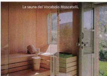
La sauna del Vocabolo Moscatelli.

DORMIRE a Calzolaro • Vocabolo Moscatelli Boutique Hotel & Restaurant : relais country chic, doppie dal design moderno, bar "Matite" con ottimi vini locali, ristorante con giardino d'inverno e piatti che reinterpretano la tradizione. Doppia da 320 euro, vocabolomoscatelli.com