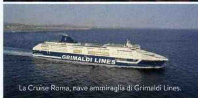
La Cruise Roma, nave ammiraglia di Grimaldi Lines.

SPETTACOLI, CABARET, GIOCHI dedicati alla Settima Arte, sessioni di risveglio muscolare e lezioni di Zumba Fitness: è un party lungo cinque giorni quello che si svolge a bordo della Cruise Roma in rotta da Civitavecchia a Barcellona. Dal 30/12 al 2/01 il "grand hotel galleggiante" attracca nella metropoli catalana: da non perdere le centrali Plaça de Catalunya e Plaça d'Espanya dagli addobbi caleidoscopici, la Torre Agbar illuminata da proiezioni video, le stradine del Barrio Gotico che profumano di torrone e "cialde" (sfoglie croccanti arrotolate), una passeggiata lungo Barceloneta Beach . Si brinda a bordo con cenone e Disco Party fino all'alba ( grimaldi-lines.com ).