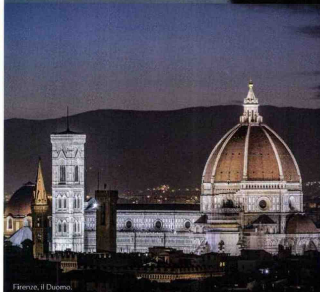
Firenze, il Duomo.

CORI GOSPEL IN PIAZZA San Lorenzo , jazz in piazza Annunziata , musica classica alla Loggia dei Lanzi , il musical Sette spose per sette fratelli al Teatro Verdi o La signora del martedì al Teatro della Pergola, ma a Firenze lo spettacolo inizia dal mattino, con le installazioni luminose del Festival Green Line 2023 (fino al 7/01), dal Ponte Vecchio a Palazzo Vecchio ( greenlinefirenze.it ). Per concedersi un lusso, ci sono i galà degli hotel più eleganti: il Se-sto on Arno del Westin Excelsior Florence, che include astice in crosta di pistacchi (450 euro), e il Winter Garden Restaurant del St. Regis Florence con cannelloni di carni bianche e tartufo bianco (500 euro). Da provare al St. Regis anche il Tea Ritual ( marriott.com ) e al Four Seasons il Brunch delle Feste (140 euro, fourseasons.com ), visittuscany.com