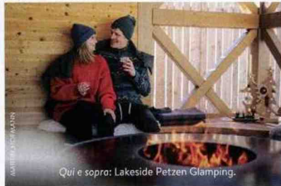
Qui e sopra: Lakeside Petzen Glamping.