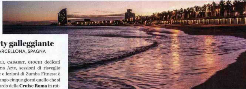
Barceloneta Beach, Barcellona.

• Lakeside Petzen Glamping , St. Michael ob Bleiburg, sul lago Pirkdorfer See, chalet e tende di design, case e saune sugli alberi, doppia b&b da 128 euro, pirkdorfersee.at ) • Hochoben , Mallnitz, campeggio e b&b di lusso a oltre 1.200 m, sulla pista di fondo, chalet con cucina per due, 2 notti da 470 euro, hochoben.at