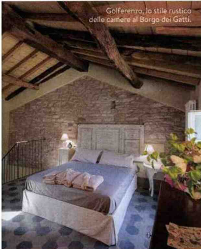
Golferenzo, lo stile rustico delle camere al Borgo dei Gatti.

IL FASCINO RURALE E LA MAGIA delle colline dell'Oltrepò Pavese rivivono a Golferenzo, dove reticoli di filari di Pinot grigio e Bonarda abbracciano le casette in pietra del relais diffuso Borgo dei Gatti. Qui si riscopre il valore del tempo chiudendo e inaugurando l'anno con sessioni di yoga, trekking e nordic walking nella foresta, corsi di cucina, calligrafia e pittura. Il cenone è alla Corte del Lupo , "enoteca con ristorante" con prodotti della tradizione reinterpretati da innovativa creatività: dal cotechino con lenticchie beluga e spuma di zabaione alla scaloppa di storione, cozze, patate e salsa di zafferano (80 euro, cortedellupo.wine ). L'escursione da non mancare è alla cappella della Madonna del Vento , a forma di vela, sopra Montalto Pavese (15 km), dove la vista abbraccia tutte le colline ( visitpavia.com ).