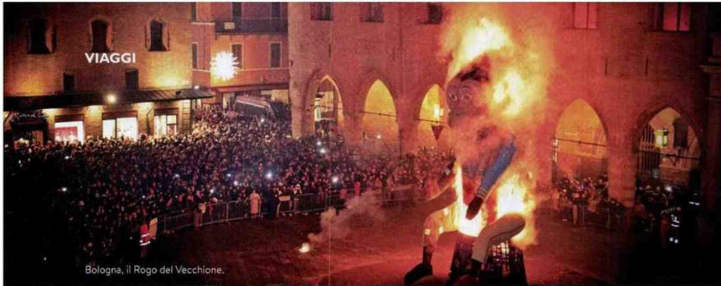
Bologna, il Rogo del Vecchione.