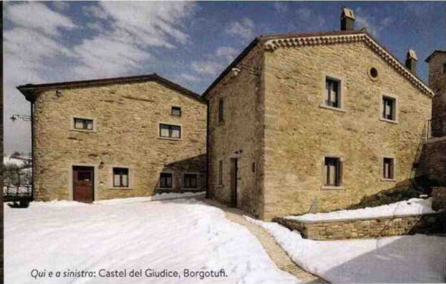
Qui e a sinistra: Castel del Giudice, Borgotufi.