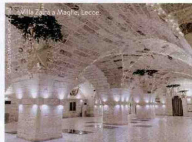
Villa Zaira a Maglie, Lecce.