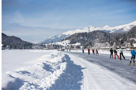
Korčuľovanie na jazere Weissensee patrí medzi veľké zážitky

Niektoré z korutánskych jazier v zime na povrchu zamrzajú, vďaka čomu sa z nich stávajú zrkadlivo hladké korčuľarske plochy pod širým nebom, na ktorých sa môžu vyblázniť tak korčuľari, ako aj hráči hokeja a milovníci curlingu. V najjužnejšej spolkovej krajine Rakúska sa nachádza aj najväčšia zamrznutá prírodná plocha Európy – jazero Weissensee. Tu sa od 20.1. do 3.2.2024 uskutočnia korčuľarske preteky – holandský okruh 11 miest. Kráľovskou disciplínou je maratón na korčuľoch dlhý viac ako 200 kilometrov.