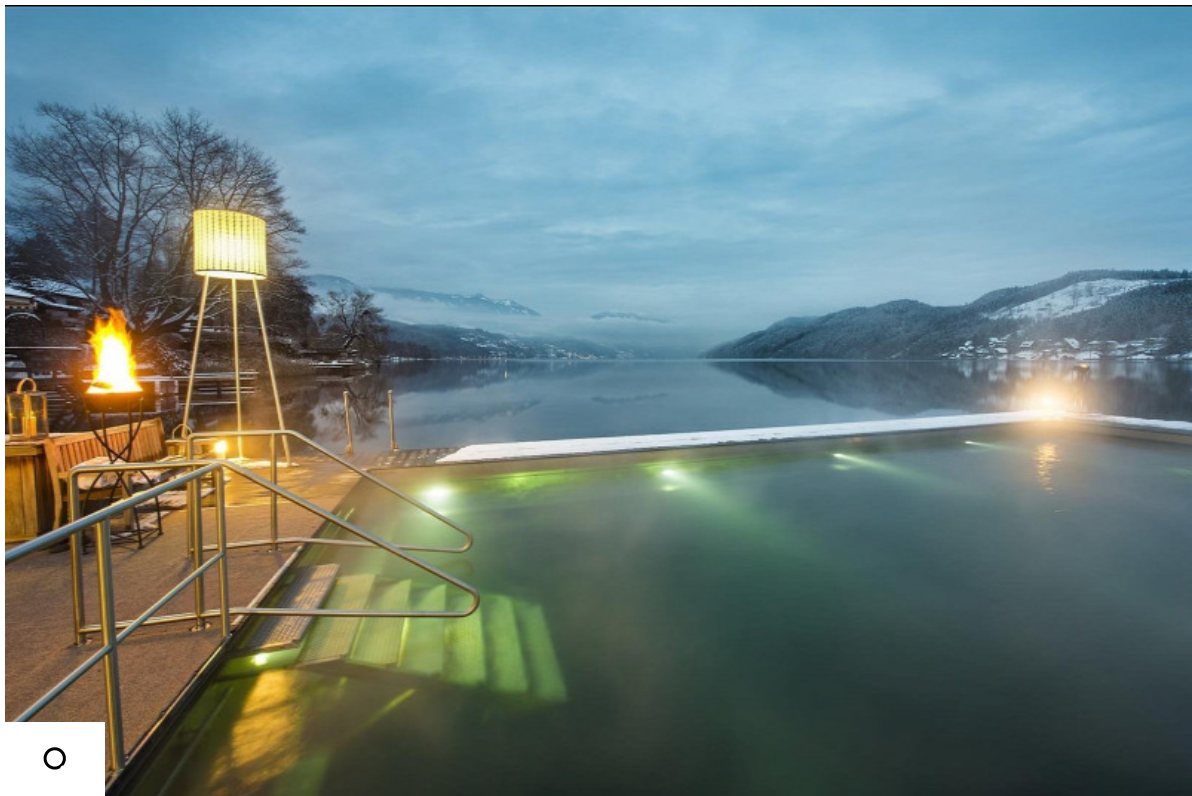
A Millstatti-tó partján fekvő Kollers hotelből kísértélva fűtött tóba merülhettek

A fűtött vizű tavi fürdők kellemes víz hőmérséklete és a lélegzetelállító alpesi panoráma igazán különlegessé teszi a téli lubickolást.