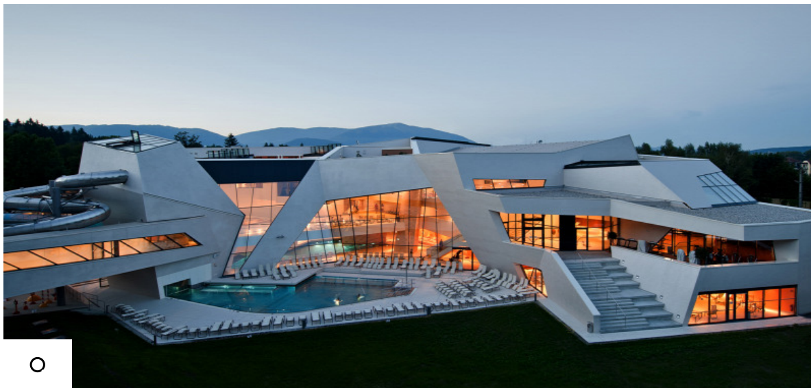
A Karintia Termálfürdő

A Dobratsch lábánál minden nap 10 millió liter 29,9 Celsius-fokos termálvíz tör a felszínre és táplálja a villachi Karintia Termálfürdő (KärntenTherme) medencéit. A különleges élményfürdő Ausztria déli részének legmodernebb termálfürdője: csúszdával a vízi élményvilágban, sportmedencével, gyermekrészleggel és tágas SPA-részleggel. Tipp: Kihagyhatatlan élmény a teliholdas szaunaszeánsz és sellőúszás-oktatás.