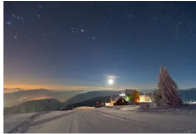
Gerlitzten in der Nacht

Die Sternwarte auf der Gerlitzten „beamt“ Gäste in den Nachtstunden in andere Galaxien. Bei Einbruch der Dunkelheit erfährt man hier bei einer Führung alles zum Thema „Faszination Astronomie – Von der Molekülwolke zur Supernova.“