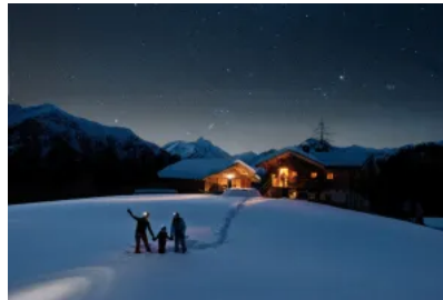
Die Nacht der Sterne in den Hohen Tauern

In der Stille der Nacht offenbart sich die Natur von einer noch faszinierenderen Seite: Die Sterne am Himmel leuchten intensiver, der Schnee glitzert geheimnisvoller, und die klare, kühle Luft belebt die Sinne noch mehr. Es ist die perfekte Zeit, um wertvolle Momente mit der Familie und mit herzlichen Gastgebern zu genießen. In Kärnten gibt es nämlich unzählige Möglichkeiten, gemeinsam unvergessliche Abenteuer zu erleben und sich von einer Welt verzaubern zu lassen, die sich erst nach Sonnenuntergang vollständig entfaltet.