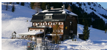
Innerkrams - Mehrlhütte