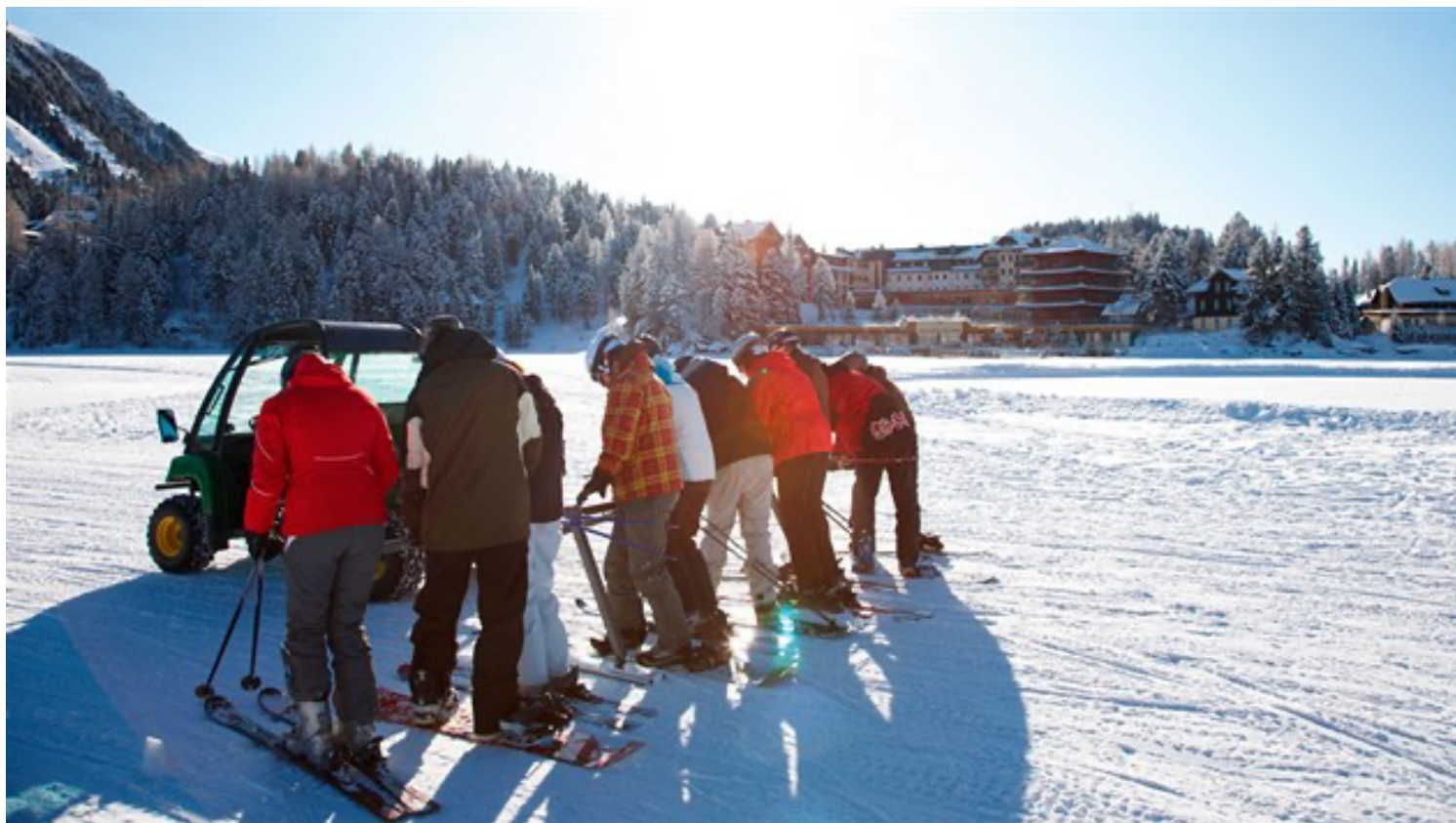
Lyžaře na sjezdovkách převáží přes jezero malý speciální traktůrek.

To přijede malý traktůrek (po zamrzlém jezeře, pochopitelně), vzadu má napojenou dlouhou tyč, tak pro osm, deset lyžařů, a vy se chytnete, traktůrek bafne, vy se nastavíte do pevného lyžařského, pro tažení vhodného postoje ..... a už se frčí. A jen se modlíte, aby se ten led pod vámi nepropadl.