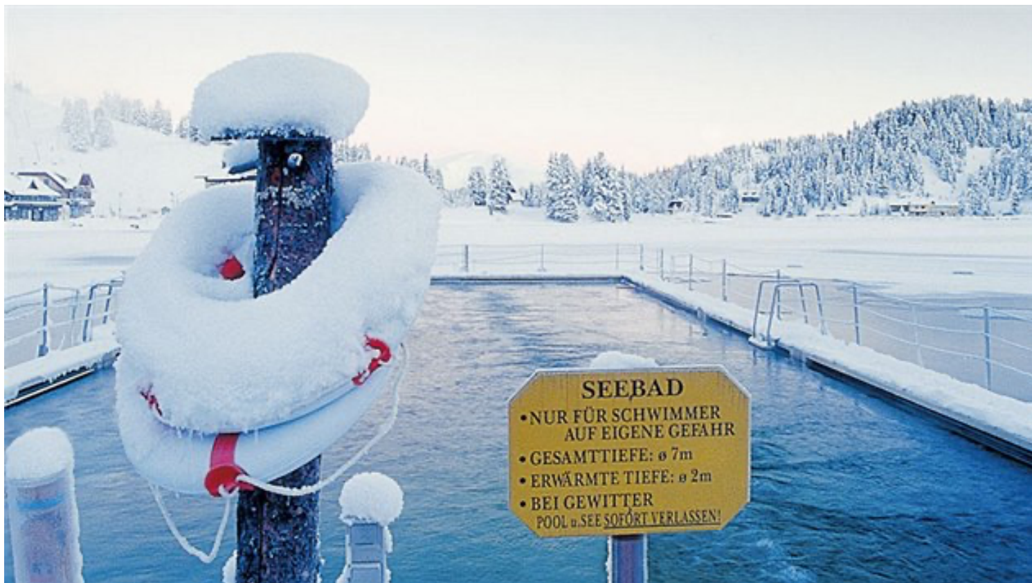
Část vysokohorského jezera je v zimě vyhřívána a dá se v ní plavat.

Hledáme parkování, protože je den jako vystřižený z katalogu cestovky a na výhledy si sem zajelo dneska víc turistů, než parkoviště snesou. Po pravé straně mjííme rozlehlou louku, spíš tedy obrovskou, a v autě se dohadujeme, jestli je to právě to jezero, na kterém se lyžuje, ale přijde nám to teď jako úplný nesmysl.