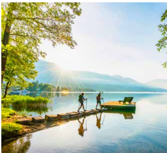
Millstätter See sa nachádza v nadmorskej výške 588 metrov, má rozlohu 13,28 km 2 a ide o druhé najväčšie jazero Korutánska. Dosahuje hĺbku až 141 metrov.

Turisti na Ceste lásky majú veľký cieľ: Granattor. Železná brána je vyplnená granátovými kameňmi a ponúka nezabudnuteľný výhľad na jazero a hory.