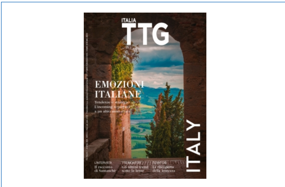
TTG ITALIA TODAY digital edition