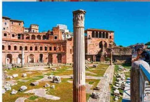
Sopra a Venezia l'ovovia accessibile sul ponte di Calatrava. A destra il Foro Romano con percorsi senza barriere. Sotto Sculture Naturalier a Peccioli, in Toscana.