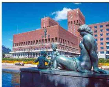
Sopra, il municipio di Oslo, in Norvegia, completamente accessibile, come quasi tutte le attrazioni, ai visitatori in sedia a rotelle. A destra, Giulia Lamarca, travel blogger in carrozzina, (@giulialamarca) in Giappone.

«In Europa, oltre ai Paesi nordici come la Norvegia consiglio la Spagna dove le spiagge sono attrezzate per tutti» dice la nostra travel