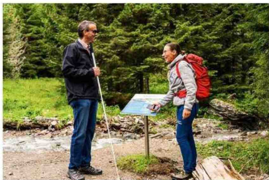
A sinistra e sotto Nockberge e lago Millstätt in Carinzia. A destra, La Gomera Playa de Santiago, alle Canarie, e la spiaggia accessibile di Bibione.