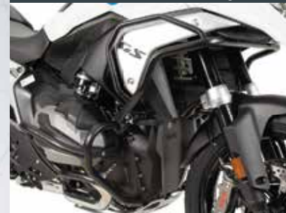
Motor- und Tankschutzbügel in schwarz, silber und aus Edelstahl