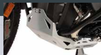
Motorschutzplatte auch in Schwarz erhältlich

das graue Band unter dir, völlig zu Recht aber als landschaftlich schöne Strecke grün-gelb auf der Karte eingezeichnet. Abstecher zum Bodental? Die Warnwetter-App rät ab. Also in Maria Rain auf der 91 über den Ferlacher Stausee und jetzt südlich der Drau auf der 85 durchs Rosental gen Gallizien, zur möglichst stop-and-go-freien Umfahrung Klagenfurts. Hochwillkommen ist der Abzweig nach Trieblich. Wie ein Kunstflieger trudelt die Straße hinab zum Fluss, kriegt dort so eben noch die Kurve und quert per Brücke die gut 200 Meter breite Drau. Großes Drohnen-Kino. Im Steigflug wieder kurvig raus aus dem Tal nach Rottenstein und via Klein Venedig und Wutschein zum nächsten Ziel. „Zum Dank an Gott für Wald und Wild“, heißt es bei Ottmanach an einer Kapelle im grünen Infield einer Sahne-Serpentine, ideal, um dankbar für solch perfekten Parcours das „Linkskurven-schön-außen-Fahren“ zu üben. Schon der Weg ist hier ein Ziel. Stairway to Heaven. Am Ende der himmelwärts führenden Knallerstrecke zum Magdalensberg dann die der heiligen »