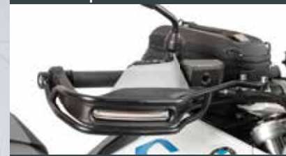
Griffschutz und weitere Schutzbügel