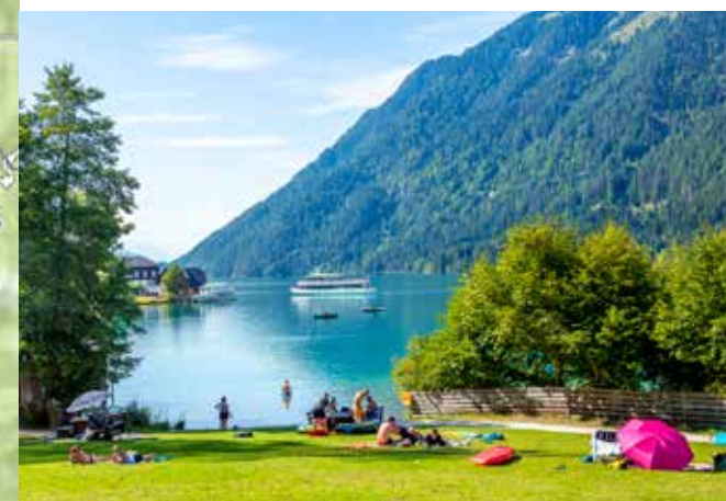
Einer der regional schönsten Gewässer: der Weissensee

Mit Kauf der „Kärnten Card“ reduzieren sich die Preise für Bergbahnen, Museen und Erlebnisbäder, es gibt sogar freie Fahrt auf der sonst mautpflichtigen Goldeck Panoramastraße und Villacher Alpenstraße sowie der (hier in den zwei Tagen nicht berücksichtigten, dennoch unbedingt einen Abstecher werten) Malta-Hochalm-Straße und Nockalmstraße. www.kaerntencard.at Wer auch zur Großglockner-Hochalpenstraße und nur Motorrad fahren will, wählt vielleicht eher das „Panoramastraßen-Ticket Kärnten“. www.kaernten.at/motorrad/panoramastrassen-ticket