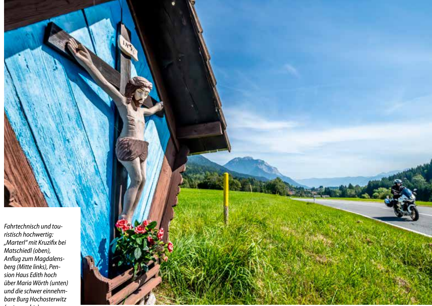
Fahrtechnisch und touristisch hochwertig: „Marterl“ mit Kruzifix bei Matschiedl (oben), Anflug zum Magdalensberg (Mitte links), Pension Haus Edith hoch über Maria Wörth (unten) und die schwer einnehmbare Burg Hochosterwitz (unten rechts)

Bis zu 16 Prozent Steigung erwarten die Guzzi bei Gassen