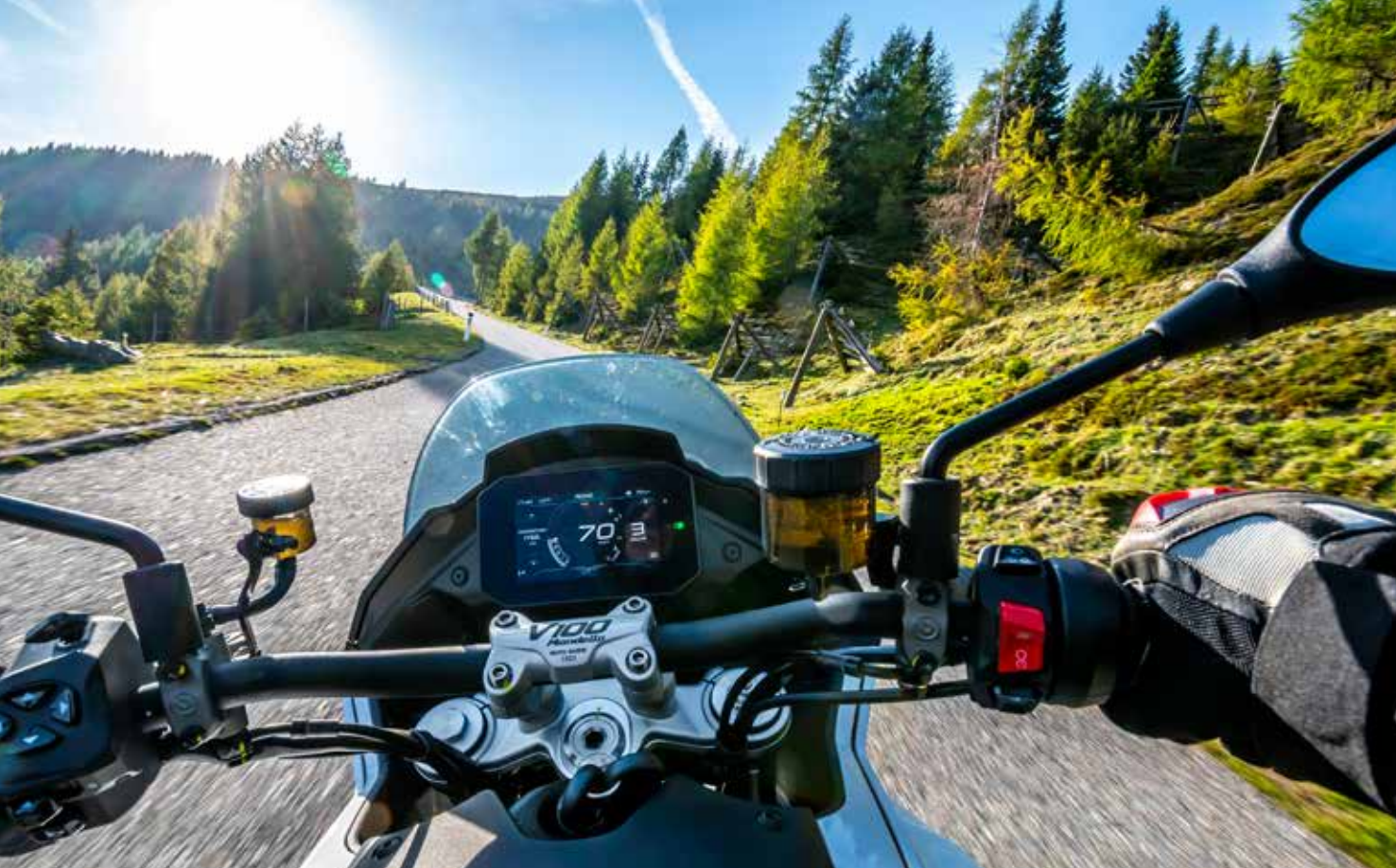
Die Goldeck Panoramastraße führt auf fast 1900 Meter: Kurven und Panoramablicke auf Millstätter Alpe, Millstätter See, Nockberge, Gailtaler Alm, Karawanken und Drautal sind inklusive (oben). Begeehrt ist das Casino Velden (unten)