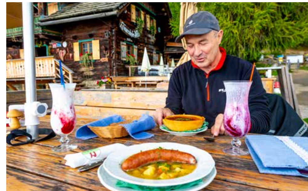
Auf der Millstätter Alm liegt die Lammersdorfer Hütte, die mit regionalen Schmankerln und Seeblick das Herz erwärmt

W enn es morgen vorm Frühstück ein bisschen laut wird, dann sind wir das“, bittet Gerd die anderen Gäste am Frühstückstisch schon mal prophylaktisch um Nachsicht. „Kein Problem, neulich waren zwölf Harleys hier – und das war viel lauter“, so die Antwort von zwei Mittfünzigern, die sich dann selbst als Fans der Milwaukee-Eisen outen; jahrelang sind sie stets mit ihren Road Kings angereist, nun aber in Begleitung ihrer besseren Hälften unterwegs, quasi inkognito, im Auto oder auch Bürgerkäfig, wie man mit Wiener Schmah so schön frotzelt. Schauplatz unserer kleinen Talkrunde ist die Terrasse der Pension Haus Edith, hoch über dem Wörthersee. Ein Paradies mit Panoramablick auf die Kircheninsel Maria Wörth und die Hügelkette am gegenüberliegenden Ufer.