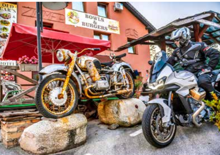
Spannender Stilmix: Old Car's Motel and Burger Bar in Velden am Wörthersee

Luft für Lunge und Airbox. Zwischen den Wipfeln des Waldes winken die Gailtaler Alpen, beim Überholen grüßen wir einen rüstigen 1200er Käfer. Freier Auslauf fürs Federvieh um einen mobilen Hühnercontainer in Heiligengeist, längst ausgelaufen der Abbau von Blei und Zink in der alten Bergarbeitergemeinde Bad Bleiberg. Die hat sich durch das zufällige Anbohren einer Thermalquelle „strukturgewandelt“ zum Kurort – inklusive der Metamorphose einiger alter Stollen zu den Schaubergwerken Terra Mystica und Terra Montana. Glückauf! In Labientschach rechts ab und via Wertschach nach Matschiedl. Ab und an ein „Hoppala, die Waldfee“, wenn's über zerfurchten Asphalt geht; aber egal, auch ohne adaptives