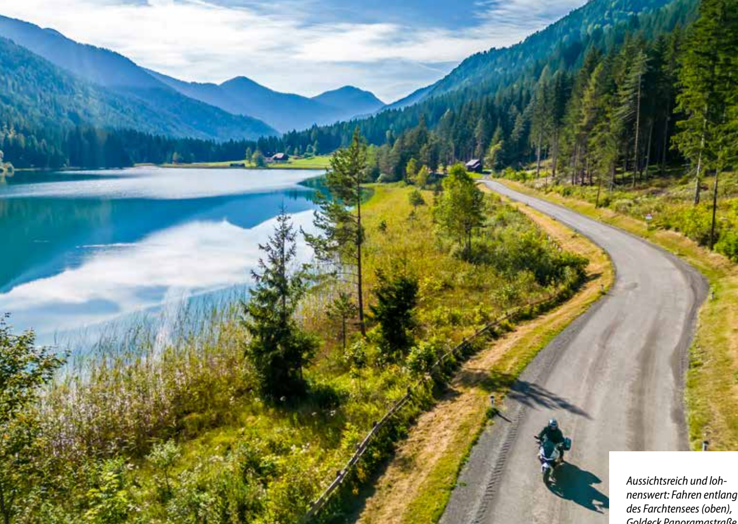
Aussichtsreich und lohnenswert: Fahren entlang des Farchtensees (oben), Goldeck Panoramastraße (Mitte links), Abendromantik in Maria Wörth am Wörthersee (links unten), Pension Haus Edith hoch über Maria Wörth (unten rechts)