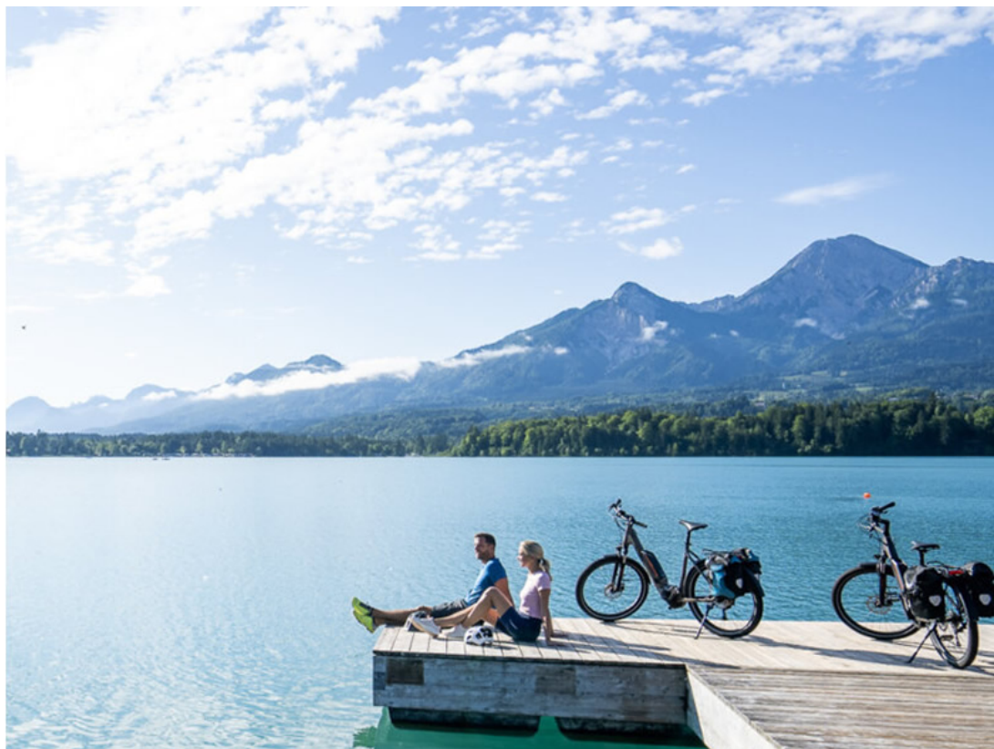
Velký korutánský jazerný okruh